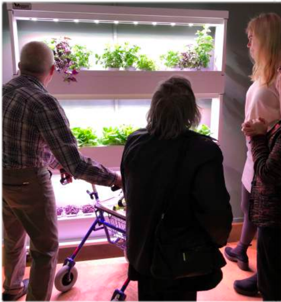
Productie van verse ingrediënten in directe omgeving